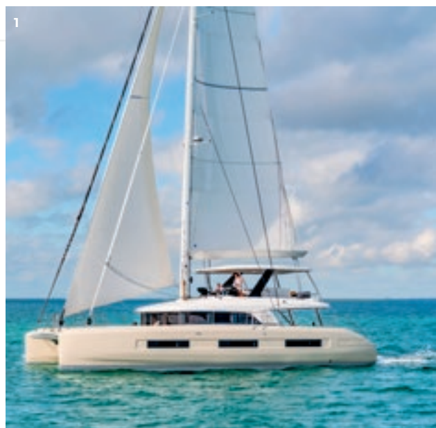
1/ LAGOON SIXTY 5

Lancé en 2020, l'EXCESS 11 est le plus petit catamaran habitable proposé et a déjà remporté plusieurs prix Boat of the Year 2020.